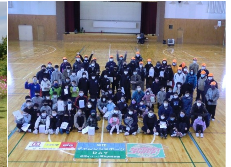
【ファミリースポーツレストラン】

令和2年度は、始まりから新型コロナウイルスに振り回され続け、先が見えないまま一年が過ぎ去ろうとしています。みんなで集まってスポーツを楽しむことも、仲間に出会うことも思うようにできずに、皆さん寂しい思いをしたのではないのでしょうか。