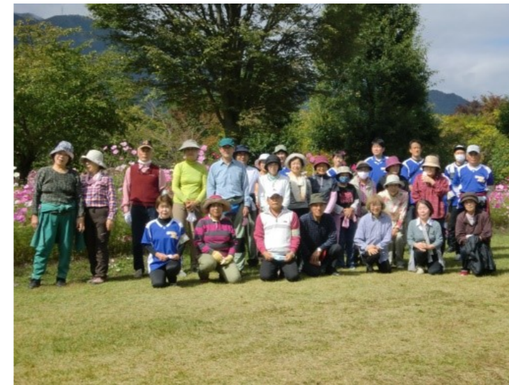
【ウォーキング教室】