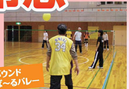
ワンバウンド ふらば～るバレー